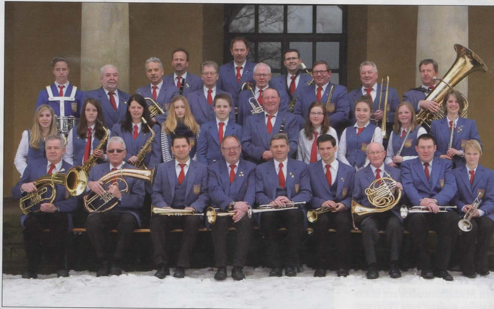
Der Musikverein Ottbergen im Jubiläumsjahr.